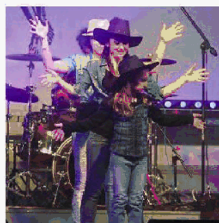
Alcuni momenti della seconda edizione di «Al di là della musica» a Delebio

DELEBIO (dns) Una serata piena di emozioni, di sentimenti, di ricordi, di musica e divertimento. Non si è smentita la seconda edizione di «Al di là della musica», la manifestazione benefica e di sensibilizzazione per la cura e la ricerca contro la leucemia che sabato scorso ha fatto